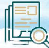
إطلاق وحدة المراجعة الداخلية