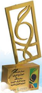
جائزة الحوار الوطني