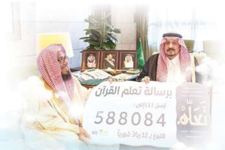
تدشين أمير الرياض لوقف تعلم