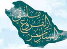
ملتقى الفروع السادس